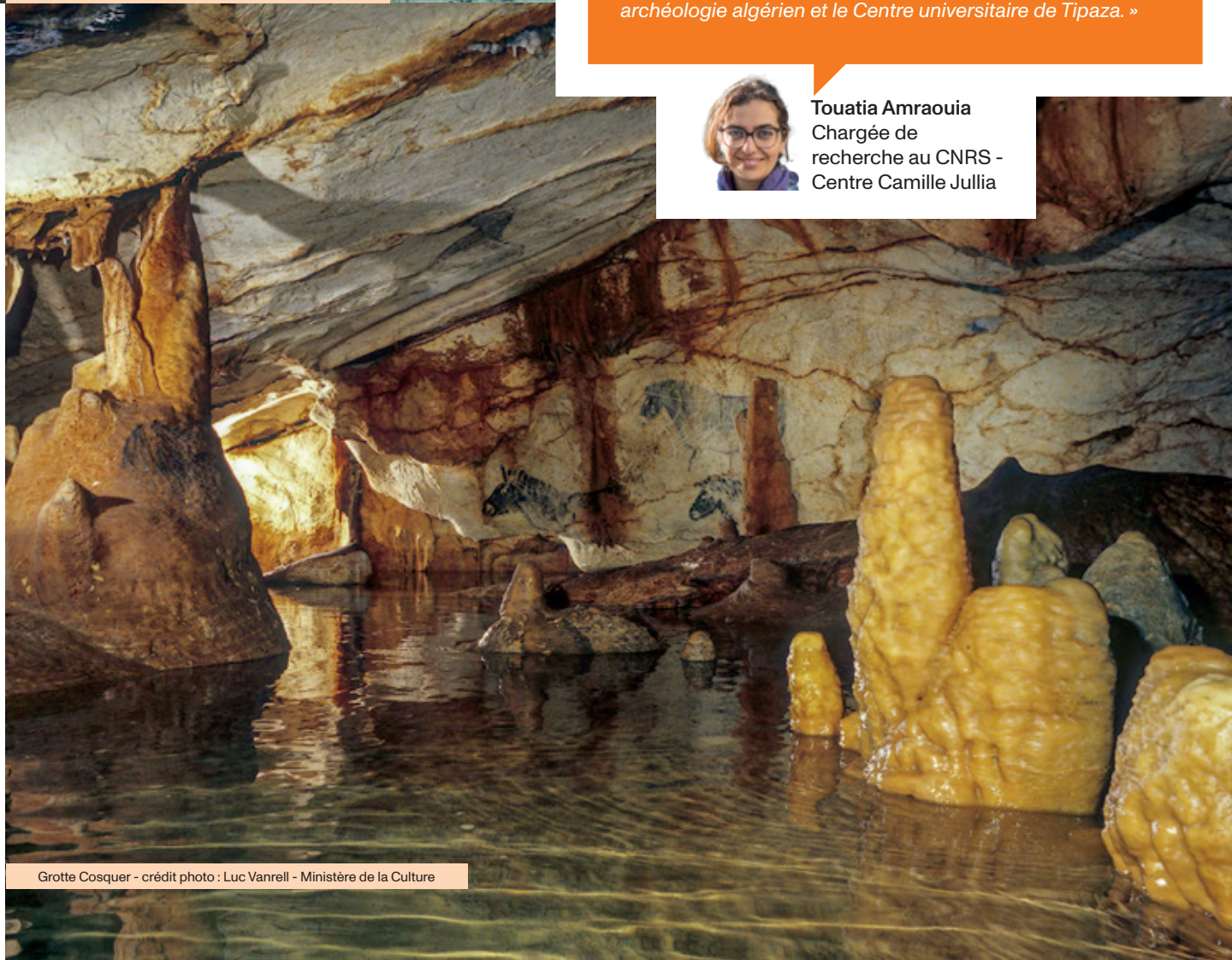
Grotte Cosquer