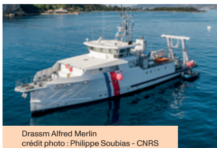
Drassm Alfred Merlin