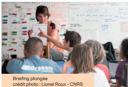
Briefing plongée

Chaire Unesco en archéologie maritime et littorale