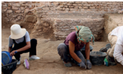
Thaenae (Tunisie)