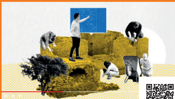
Présentation de l'institut