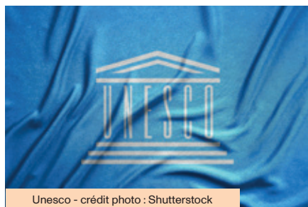
Unesco - crédit photo : Shutterstock