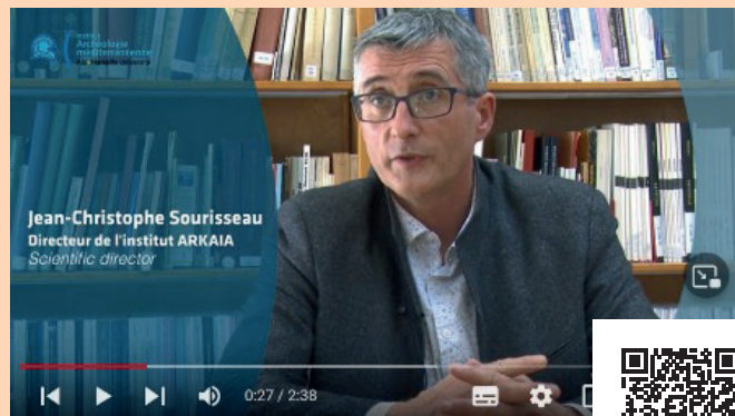
L'institut vu par ses membres