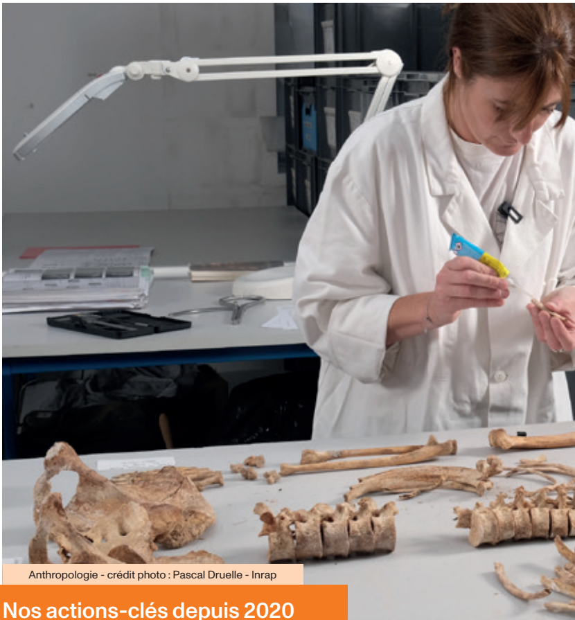
Anthropologie - crédit photo : Pascal Druelle - Inrap